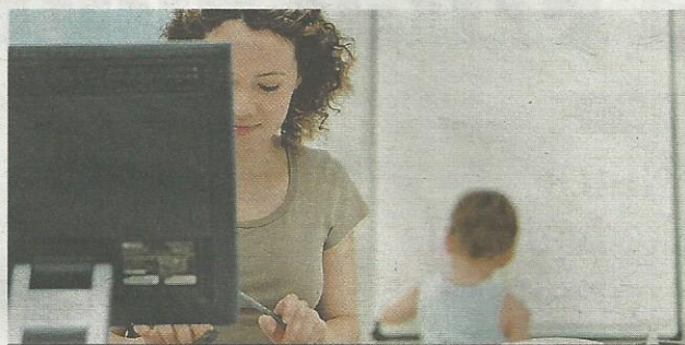
További információ: ifka.hu, munkakisgyermekkel.hu

A Munka kisgyermekkel (MuKi) program 320 céggel épített ki kapcsolatot, 306 kisgyermekes szülővel szerződött, és segítségével eddig 145 kismama dolgozik ismét – hangzott el a MuKi zárókonferenciáján. A program célja egyrészt az volt,