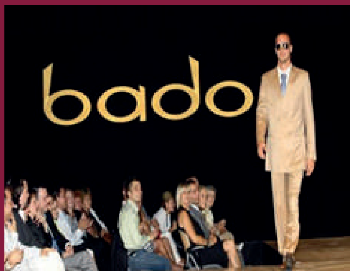
image film készítése, szponzorációs stratégia kidolgozása, sajtókapcsolatok, sajtóanyagok, közlemények készítése és kiküldése a célmédiumok részére

Divatmarketing, bevezető kommunikációs kampány, teljes körű (nagy) arculattervezés, 450 fős divatbemutató szervezése a magyar vízilabda válogatott részvételével a T-Com székházban a T-Mobile támogatásával, katalógusfotózás,